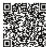
Foto: pahnis – stock.adobe.com, Illustrationen: Anna-Lena Kähler, sabelskaya – stock.adobe.com

Auch der Fachbereich Bildungseinrichtungen hat umfangreiche Infos zur Verkehrserziehung in Kitas: