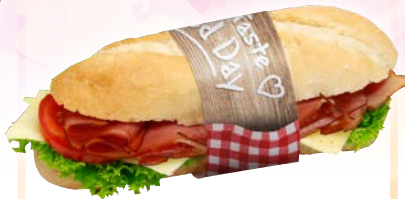
Art. 99699* Banderole „goodDay“

Maße: L 30,0 x B 4,0 cm Gewicht: 1,2 g, 500 St. / Kt.