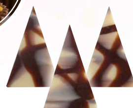
Art. 70111* Dekor „Diablo Triangle“

Maße: B 3,4 x H 5,2 cm Gewicht: 585 g, 1 St./Kt. Service-Welt