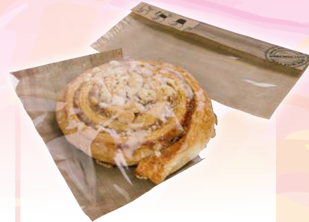
Art. 58557* Snack-Verpackung Panvas „Square“

Maße: L 20,0 x B 18,0 cm Gewicht: 2,5 g, 500 St. / Kt.