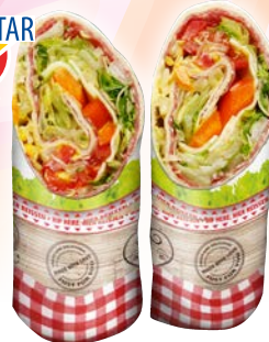
Art. 55284* WrapBag „goodDay“

Maße: L 30,3 x B 26,2 cm Gewicht: 7 g, 500 St. / Kt.