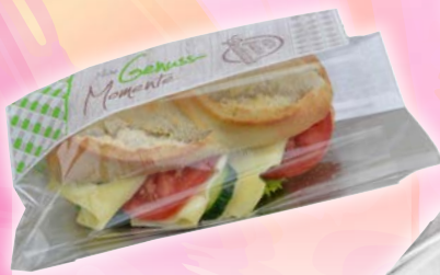
Art. 57407* Sichtfensterbeutel „Genuss-Momente“, 12 x 28 x 5 cm

Maße: L 5,0 x B 12,0 x H 28,0 cm Gewicht: 3,5 g, 1000 St. / Kt.