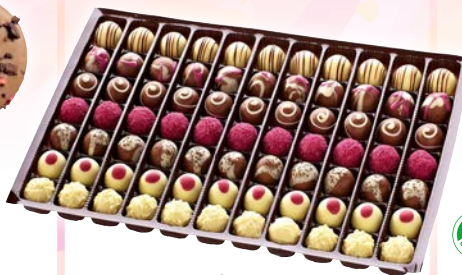
Art. 51885* Trüffelmischung „Ladies Collection“

Maße: Ø 4,5 cm, L 11 cm Gewicht: 13 g, 44 St./Kt. Service-Welt