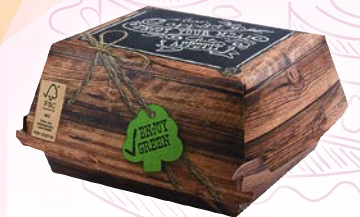
Art. 56243* Burgerbox „Enjoy Green“, 13,5 x 12,5 x 7,5 cm

Maße: L 13,5 x B 12,5 x H 7,5 cm Gewicht: 20,3 g, 400 St. / Kt.