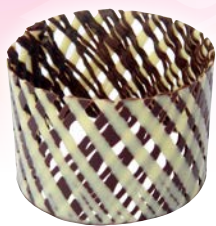
Art. 70126* Schokoringe „Duo“

Maße: Ø 5,5 x H 4,0 cm Gewicht: 7,8 g, 40 St./Kt. Service-Welt