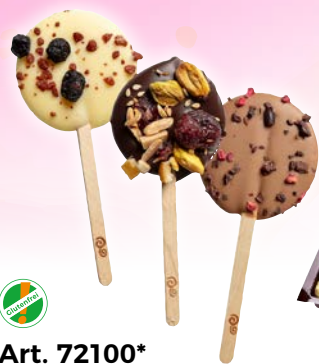
Art. 72100* EDNA Schokoladen-Lollies

Maße: Ø 3,0 x L 10,5 cm Gewicht: 21 g, 57 St./Kt. Service-Welt