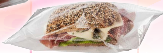
Art. 93775* Beutel, genadelt, 30 x 20 cm

Maße: L 30,0 x B 20,0 cm Gewicht: 2,8 g, 1000 St. / Kt.