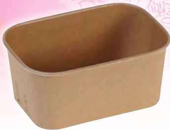
Art. 99312* Schale „Kraft/PLA“, 1000ml

Maße: L 17,3 x B 12,0 x H 7,5 cm Gewicht: 19,4 g, 300 St. / Kt.