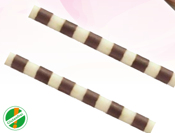
Art. 70102* Dekor „Mikado“

Maße: Ø 5,5 x H 4,0 cm Gewicht: 7,8 g, 40 St./Kt. Service-Welt