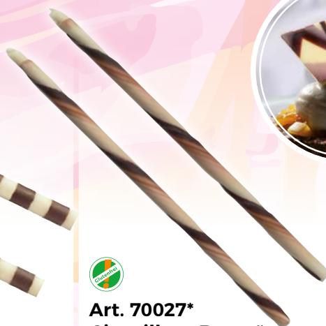
Art. 70027* Cigarillos „Retro“

Maße: Ø 0,4 cm, L 9,7 cm Gewicht: 700 g, 1 St./Kt. Service-Welt