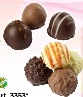
Art. 3353* Pralinen-/Trüffel-Mischung