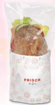
Art. 53898* Snack-Bag „FRISCH & fein“, 18 x 7 x 13 cm

Maße: L 18,0 x B 7,0 x H 13,0 cm Gewicht: 4,7 g, 1000 St. / Kt.