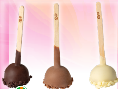
Art. 72110* EDNA Dessert Lollies

★ Mit unseren kreativen Dekoren verwandeln Sie Desserts, Torten oder Eis mit wenig Aufwand in einen wahren "Hingucker".